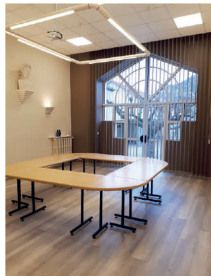
La rénovation de la salle du conseil en 2019