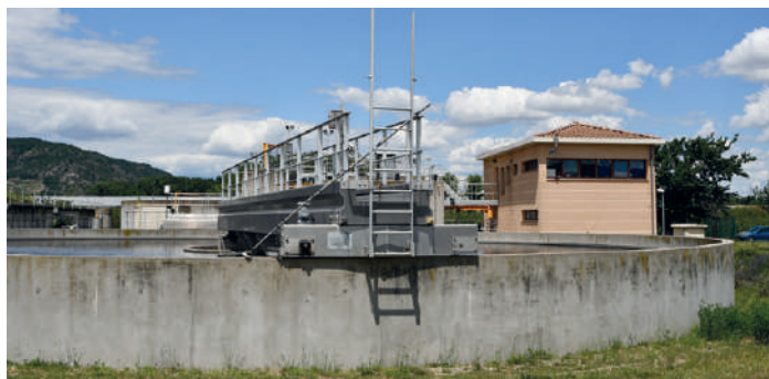
Station d'épuration du site d'Andancette

La compétence réseaux assainissement a été transférée à la Communauté de communes Porte de DrômArdèche depuis le 1 er janvier 2020. Un état des lieux et une étude technique et financière ont été réalisés par cette dernière. Il en a découlé un plan pluriannuel d'investissement, qui a été présenté aux communes sur les travaux à réaliser (2020 à 2029).