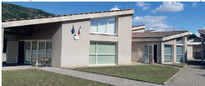
L'école maternelle à Andancette

Lors du précédent mandat, la commission a travaillé sur la mise en place des temps d'activités périscolaires.